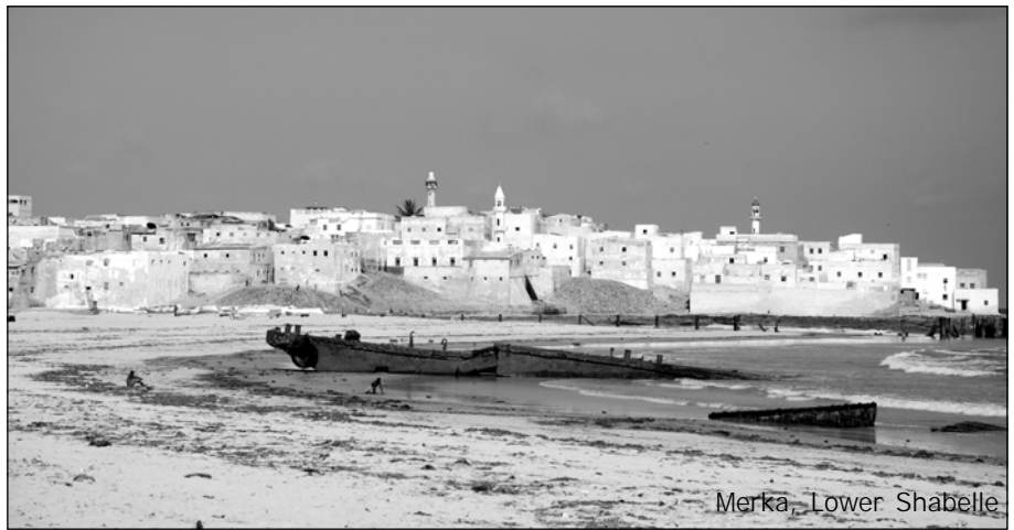
Merka, Lower Shabelle