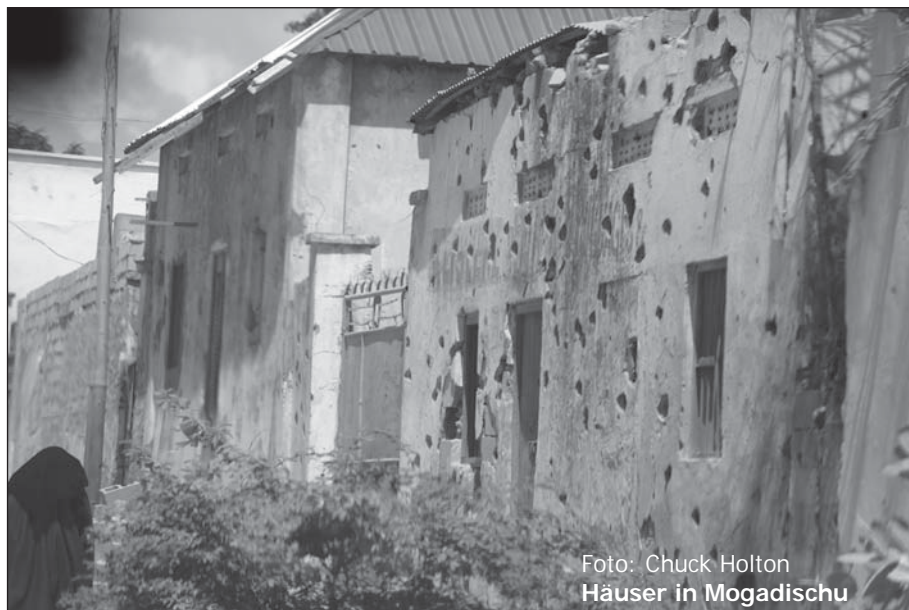
Häuser in Mogadischu