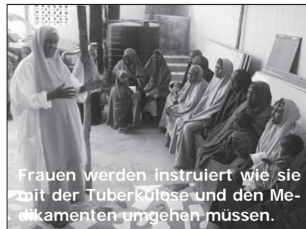
Frauen werden instruiert wie sie mit der Tuberkulose und den Medikamenten umgehen müssen.

Zum Vergleich: Ende 2011 hielten sich gut 77'000 Personen aus dem Asylbereich in der Schweiz auf. Im Verhältnis zur Gesamtbevölkerung der Schweiz beträgt der Anteil von Flüchtlingen, vorläufig aufgenommenen Personen und Asylsuchenden rund 1 %.