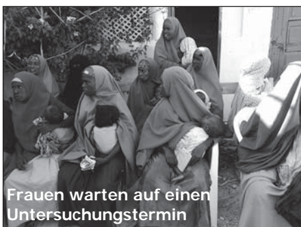
Frauen warten auf einen Untersuchungstermin

1946 wurde das Antibiotikum Streptomycin entwickelt, mit dem eine erfolgreiche Behandlung der Tuberkulose möglich wurde. Trotzdem wurde diese heimtückische Krankheit bis heute nicht ausgerottet. Immer noch erkranken jährlich schätzungsweise neun Millionen Menschen an Tuberkulose und etwa 1,4 Millionen sterben daran. Auch in Somalia, das seit über zwanzig Jahren von einem Bürgerkrieg heimgesucht wird, ist