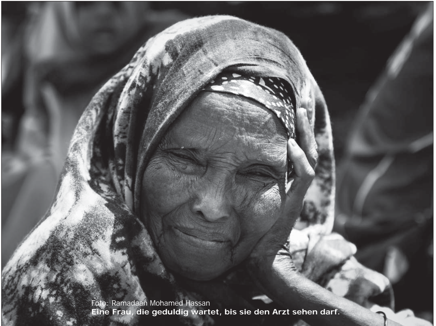
Eine Frau, die geduldig wartet, bis sie den Arzt sehen darf.