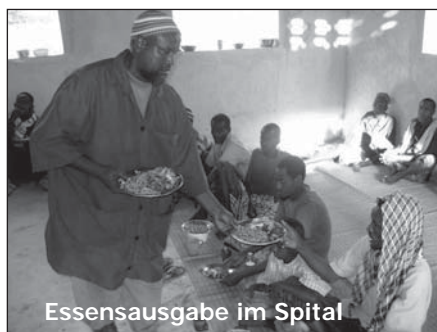
Essensausgabe im Spital