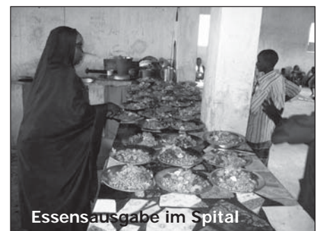
Essensausgabe im Spital